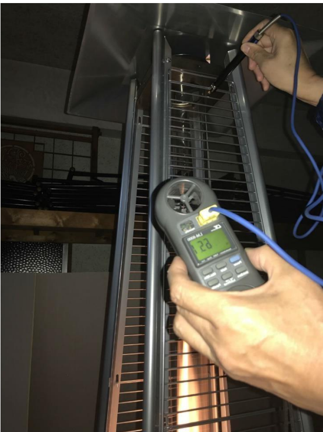
④計測地点の表面温度