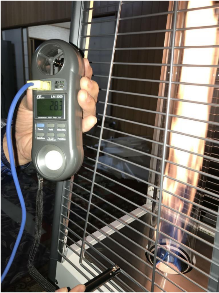
②計測地点の表面温度