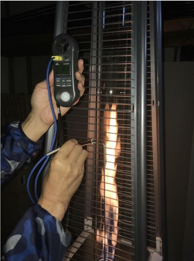
③計測地点の表面温度