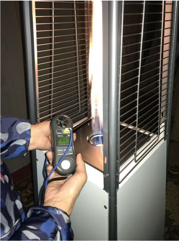
⑤計測地点の表面温度